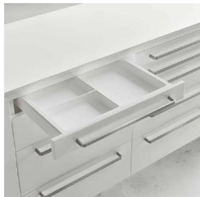
Cassetti con bacinelle facilmente estraibili Drawers with easily removable trays / Tiroirs avec intérieurs facilement amovibles / Schubladen mit leicht ausziehbaren Einsätzen / Cajones con bandejas fácilmente extraíbles

Like è un mobile che nell'essenzialità ha il suo punto di forza. Con basamento chiuso o piedi, è modulabile e soddisfa sempre le necessità del lavoro nello Studio.