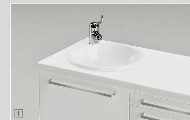
1 Piano in Laminato, sp. 20 mm, lavello inox smaltato (o lavello in ceramica a filo piano) / Laminated worktop, 20 mm thick, glazed stainless steel sink (or flush ceramic bowl) / Plan de travail en Laminé, ép. 20 mm, évier en inox émaillé (ou évier porcelaine collée sous le plan) / Arbeitsplatte aus Laminat, St. 20 mm, Waschbecken aus emailiertem Edelstahl (oder Porzellanwaschbecken bündig mit der Arbeitsplatte) / Encimera de Estratificado, de 20 mm de esp., lavabo de acero inoxidable esmaltado (o lavabo de cerámica a ras de la encimera) 2 Piano in Stratificato, sp. 12 mm, lavello ceramica / Stratified laminate worktop, 12 mm thick, ceramic sink / Plan de travail en Stratifié, ép. 12 mm, évier en céramique / Arbeitsplatte aus Schichtstoff, St. 12 mm, Waschbecken aus Keramik / Encimera de Estratificado, de 12 mm de esp., lavabo de cerámica

TOP AND SINKS | PLANS DE TRAVAIL ET ÉVIERS | ARBEITSPLETTEN UND WASCHBECKEN | ENCIMERAS Y LAVABOS