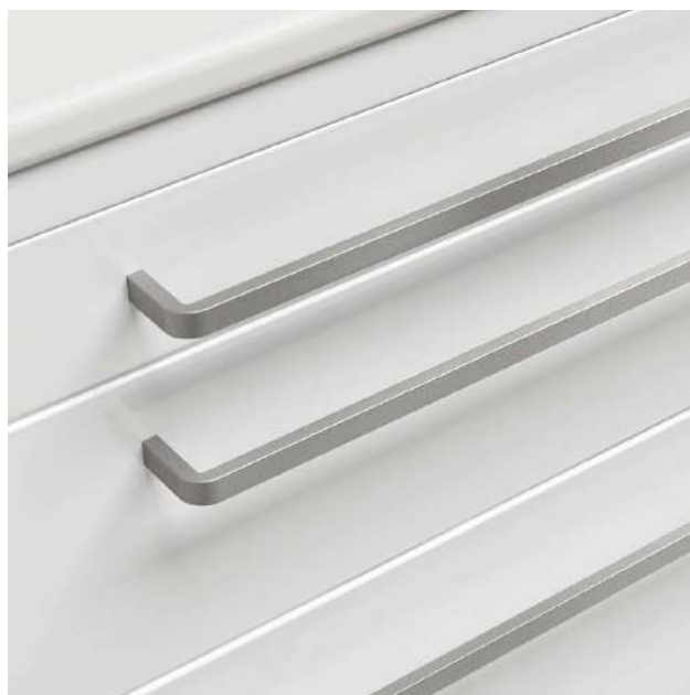
Nuova maniglia in alluminio anodizzato New handle in anodised aluminium / Nouvelle poignée en aluminium anodisé / Neuer Griff aus eloxiertem Aluminium / Nueva manija de aluminio anodizado