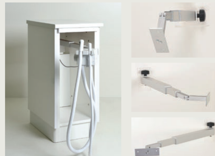
Bras télescopique avec tête articulée. Fermé 370 mm, ouvert 890 mm.