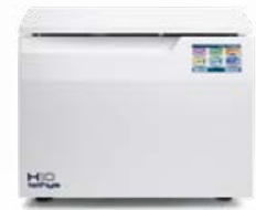
Tethys H10 plus THERMO-DÉSINFECTION