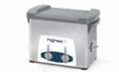
Highea 3 LAVAGE