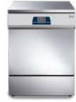
Tethys T60 - Tethys D60