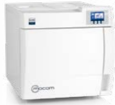
B Classic AUTOCLAVES