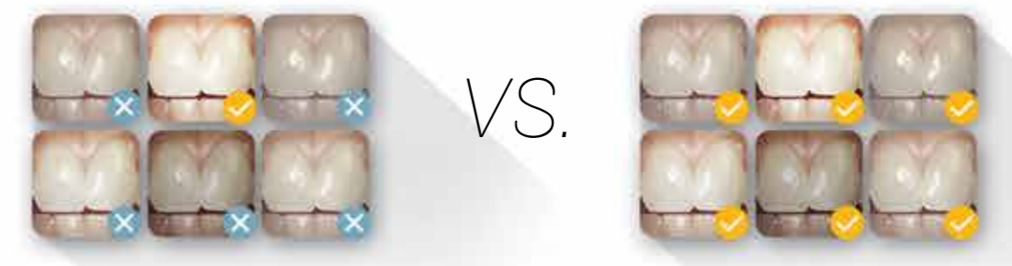
Schéma de teintes intelligent

LE CS 3700 : BRDF : distribution bidirectionnelle de la réflectance