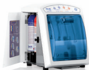
LUBRICARE Système de maintenance REF. 1600915-001