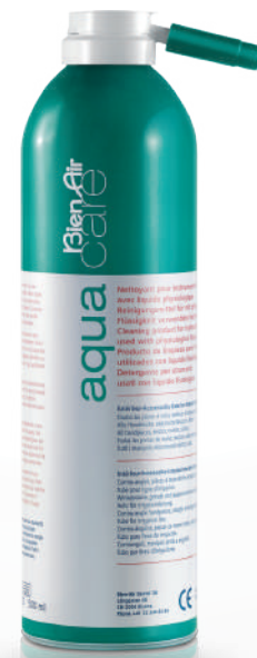
AQUACARE 500 ml spray de nettoyage. Emballage de 6 pièces REF. 1600617-006