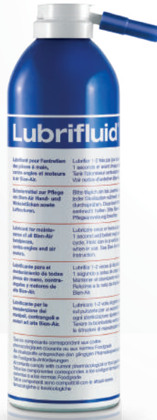
LUBRIFLUID 500 ml lubrifiant Emballage de 6 pièces REF. 1600064-006