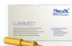
LUBRIMED Emballage de 6 cartouches REF. 1600037-006