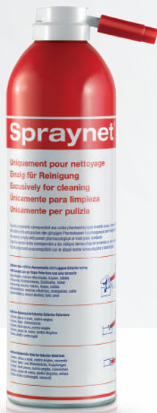
SPRAYNET 500 ml spray de nettoyage. Emballage de 6 pièces REF. 1600036-006