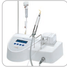
PIEZOSURGERY® II valeur reprise 3 000.00 € TTC prix d'achat 11 154.00 € TTC