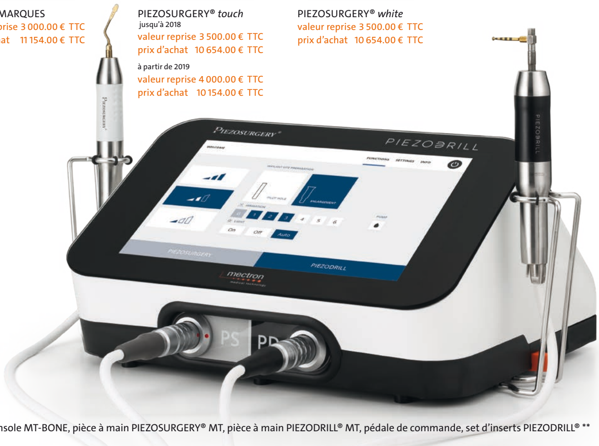
à partir de 2019 valeur reprise 4 000.00 € TTC prix d'achat 10 154.00 € TTC

avec : console MT-BONE, pièce à main PIEZOSURGERY® MT, pièce à main PIEZODRILL® MT, pédale de commande, set d'inserts PIEZODRILL® **