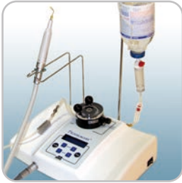
PIEZOSURGERY® I valeur reprise 3 000.00 € TTC prix d'achat 11 154.00 € TTC