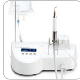
PIEZOSURGERY® 3 valeur reprise 3 000.00 € TTC prix d'achat 11 154.00 € TTC