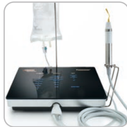
PIEZOSURGERY® touch jusqu'à 2018 valeur reprise 3 500.00 € TTC prix d'achat 10 654.00 € TTC