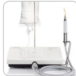
PIEZOSURGERY® white valeur reprise 3 500.00 € TTC prix d'achat 10 654.00 € TTC